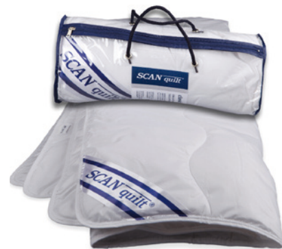
PEŘINA CLASSIC SLIM

Vybírat můžete z široké nabídky vzorů i barev. Pestré květinové vzory plné lučního kvítí, krásných hortenzií nebo růží vnesou svěží energii a dobrou náladu do každého interiéru. Proužky, lodičky a další motivy v námořnickém stylu naopak pobídnou k vyplutí za letním dobrodružstvím.