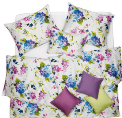
POVLEČENÍ SATÉN DESIGN

Pokud si nevíte rady s výběrem správné tkaniny povlečení, dobrou volbou mohou být SATÉNY Plus, které jsou hladké a kde na hedvábném povrchu krásně vynikne potištěný vzor. Zvolit můžete ale i jednobarevné provedení. Neméně žádané je v poslední době také úpletové povlečení mako JERSEY, které je hebké a stejně splývavé jako jemné noční prádlo a rovněž se nemusí žehlit.