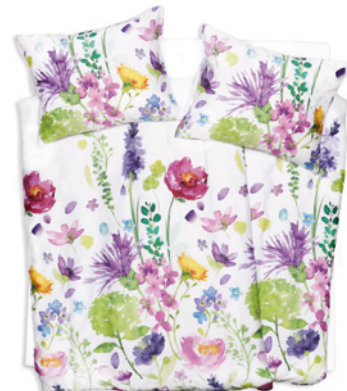
POVLEČENÍ SATÉN TENCEL DESIGN

Vybírat můžete z široké nabídky vzorů i barev. Pestré květinové vzory plné lučního kvítí, krásných hortenzií nebo růží vnesou svěží energii a dobrou náladu do každého interiéru. Proužky, lodičky a další motivy v námořnickém stylu naopak pobídnou k vyplutí za letním dobrodružstvím.