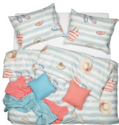
POVLEČENÍ KLASIK DESIGN

Krásné slunečné dny milujeme všichni, teplé noci už ale v oblíbě tolik nemáme. A když se ještě o půlnoci převalujeme z boku na bok a převlékáme si už druhou noční košili, zasloužený odpočinek a řádný spánek je v nedohlednu. Odborníci na výrobu kvalitních lůžkovin SCANquilt přichází s výběrem materiálů, které vám zpříjemní letní snění, abyste se i během parných nocí vyspali do růžova.