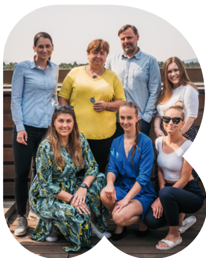
TÝM CENTRA KRAKOV

V duchu superhrdinství se nesla oslava konce školního roku, která se již dlouhodobě těší oblibě u malých i velkých školáků. Tentokrát na děti čekalo devět stanovišť s adrenalinovými, sportovními, kreativními i kvízovými úkoly. Děkujeme za hojnou účast a těšíme se na brzké setkání na další akci.