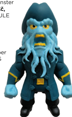
Flexi monster 199 Kč, BAMBULE