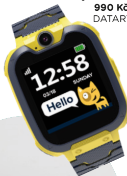
Chytré hodinky Canyon Tony KW-31 - dětské 990 Kč, DATART