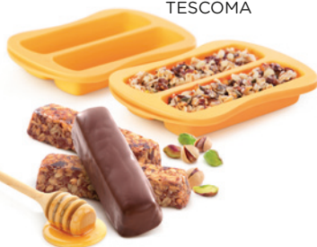
Formičky na zdravé tyčinky DELLA CASA, 3 ks 269 Kč, TESCOMA