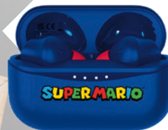
Sluchátka OTL Technologies Super Mario Blue TWS 899 Kč, DATART