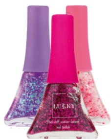
Lak na nehty LUKKY (různé druhy) 129 Kč, BAMBULE