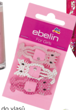
Dětské sponky do vlasů kočička ebelin, 3 ks 59,90 Kč, dm drogerie markt