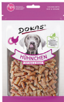
DOKAS Kuřecí mini kousky pro psy 70 g, 59 Kč, HappyZoo

Abyste neměli kapsy plné drobků od psích dobrot, pořídte si sáček na pamlsky neboli pamlskovník. Mňamek se do něj vejde tak akorát, díky stahovacím páskám se nic nevysype a vy budete mít volné ruce pro sportování. Během tréninku nezapomínejte také na vodu, kterou bychom měli mít, především v parných dnech, vždy po ruce.