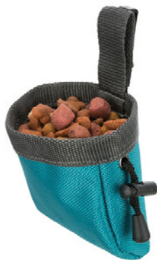
Sáček na pamlsky TRIXIE Baggy de Luxe 8x10 cm, 59 Kč, HappyZoo

Co může být pro psa lepší motivací než drbání za ušima? Jednoznačně pamlsky! Dbejte na vhodný výběr pamlsků, výživová hodnota hraje při sportování důležitou roli. Piškoty raději odložte a zvolte funkční pamlsky, sušené maso nebo oblíbené granule. Pozor také na množství rozdaných dobrůtek, ty by se měly zohlednit v běžné krmné dávce zvířete.