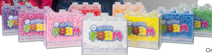
Ultra Foam mini 99 Kč, BAMBULE