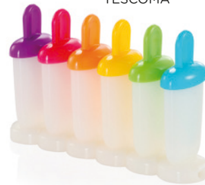
Mini tvořítka na zmrzlinu BAMBINI, 6 ks 209 Kč, TESCOMA