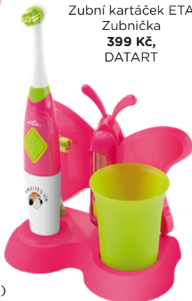
Zubní kartáček ETA Zubnička 399 Kč, DATART