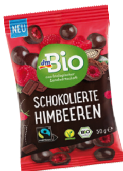
Bio maliny v čokoládě dmBio, 50 g 44,90 Kč, dm drogerie markt