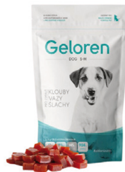
GELOREN Dog S-M 180g (60tbl), 489 Kč, HappyZoo

Pokud vás a vašeho psa sportování chytne a budete sportovat pravidelně nebo dokonce na závodní úrovni, mějte na paměti vyváženou stravu, která by měla být bohatá na kvalitní suroviny a bílkoviny. Podceňovat by se také neměly kvalitní doplňky stravy, převážně pak kloubní výživa na podporu správného fungování pohybového aparátu.