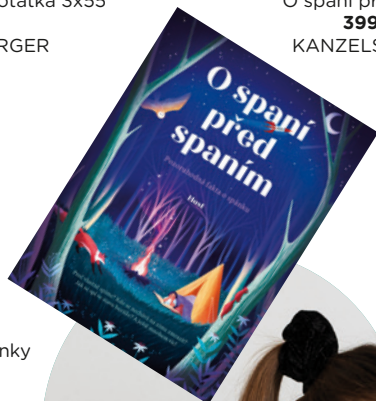
O spaní před spaním 399 Kč, KANZELSBERGER