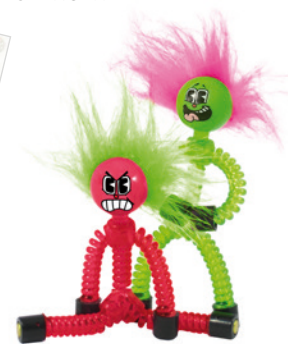
Hároš Magmák 149 Kč, BAMBULE

Ceny jsou pouze orientační a mohou se měnit.