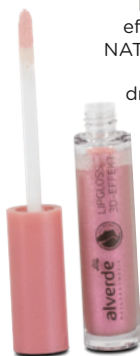
Lesk na rty s 3D efektem O2 alverde NATURKOSMETIK, 5 ml 99 Kč, dm drogerie markt