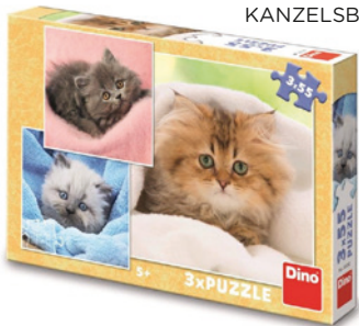
Puzzle Roztomilá koťátka 3x55 199 Kč, KANZELSBERGER