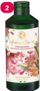
Voňavá kombinace pro mámu & dceru