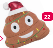
Vtipná pískací hračka pro psy