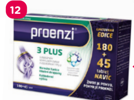
Pro zdraví a vitalitu